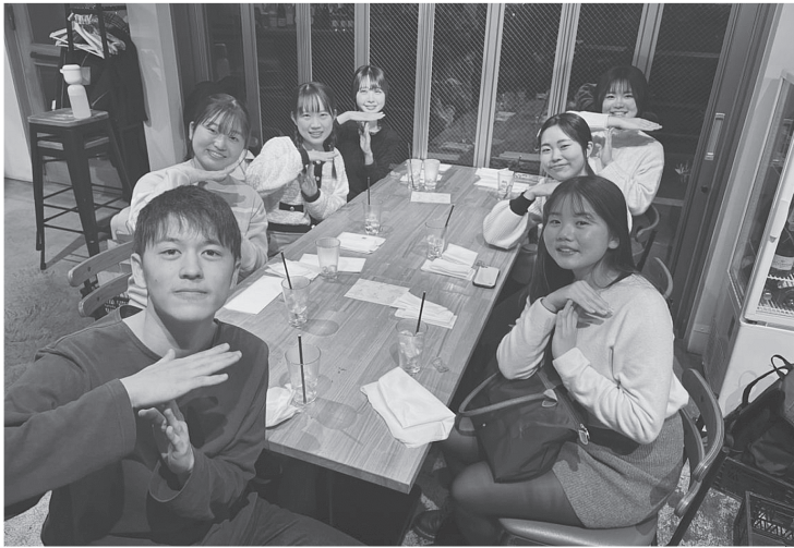
TABLE FOR TWO 一橋大学